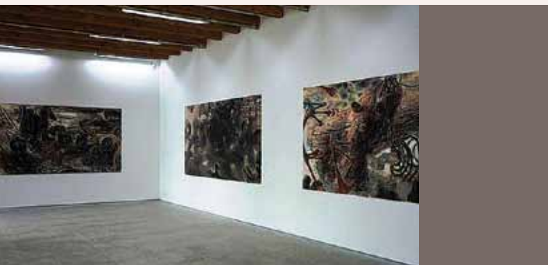
Openingstentoonstelling met werken van Hans de Wit