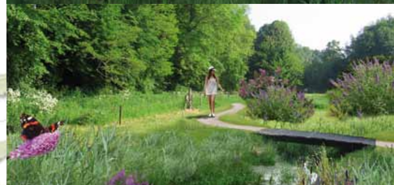
Gazebo van Diepenheim

KunstWerk Diepenheim is een samenspel van Kunstvereniging Diepenheim, stichting KUNSTen Op Straat, stichting Cultureel Erfgoed Hof van Twente, de gemeente Hof van Twente en het Waterschap Regge en Dinkel. Met steun van de provincie Overijssel wordt de positie van Diepenheim als spraakmakend knooppunt van kunst en cultuur fors uitgebouwd.